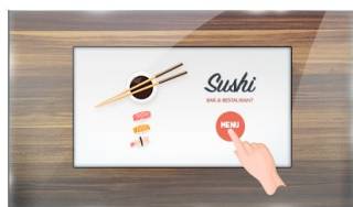
Touch durch Glas

Der Open-Frame ProLite TF1015MC verwendet die PCAP-Touch-Technologie und ist verbaut in einem formschönen Edge-to-Edge Glas Design. Dank seiner Glasauflage und dem robusten Rahmen garantiert der Bildschirm eine hohe Haltbarkeit und Kratzfestigkeit und ist somit ideal für Kiosksysteme und Anwendungen im öffentlichen Einsatz geeignet. Die IPS-Panel-Technologie bietet eine präzise und konsistente Farbwiedergabe mit weiten Betrachtungswinkeln. Ausgestattet mit einer Schaumstoffdichtung bietet das Gerät eine nahtlose Integration in Kiosksysteme. Mit der IP65 Zertifizierung bietet das Gerät eine Staub- und Wasserresistenz in der Bedienung. Die Ausrichtungsoptionen Quer- und Hochformat sorgen für flexible Montagemöglichkeiten. Der TF1015MC kann mit separat erhältlichen Befestigungswinkeln ausgestattet werden ( OMK2-1 ), die den Einbau erleichtern. Die ideale Lösung für Kiosksysteme, industrielle Umgebungen, Kontrollräume und interaktive Multimedia-Anwendungen.